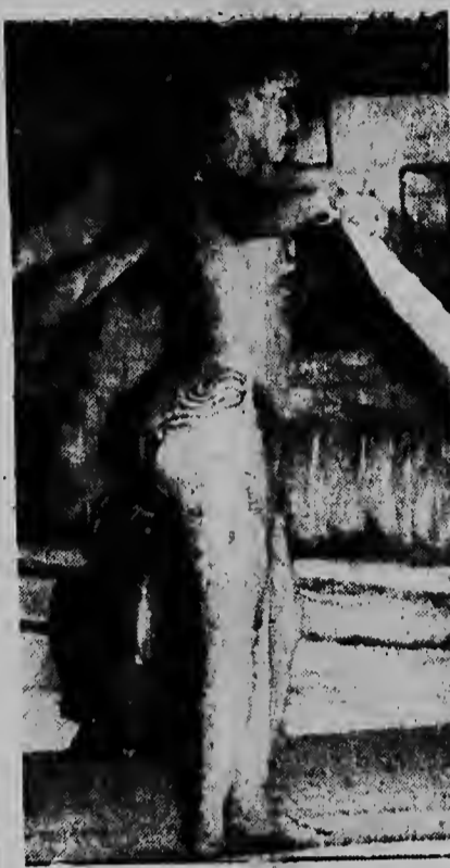
„Helena“, bailarina curazoleña en lo actua den Club Watapana dia Sabra anochi